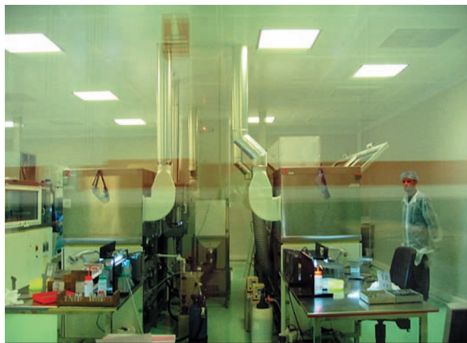
Нанесение упрочняющих покрытий в особо чистом помещении

производство, начиная от комплектовки заказа, обработки поверхности, нанесения покрытий и до отправки заказчику. Управляющая программа позволяет структурировать выполняемые заказы в зависимости от их сложности и даты, оптимизирует загрузку станков-генераторов и другого технологического оборудования. В переоснащение этого производства компания инвестировала 5 млн евро. Сотрудники фирмы с гордостью отмечают, что сегодня этот завод является одним из лучших в Европе. Здесь выпускают линзы по технологии «Free-form», в том числе и прогрессивные, из органических материалов с показателями преломления 1,523; 1,60 и 1,67. На заводе производится нанесение упрочняющих, многослойных просветляющих и гидрофобных покрытий.