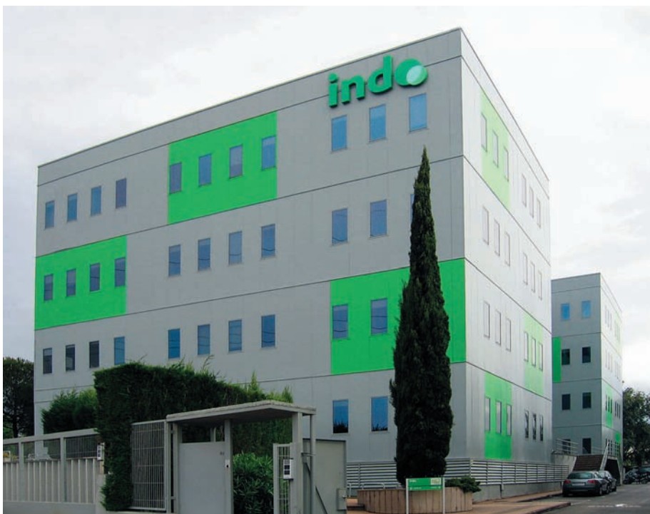
Штаб-квартира компании «Indo International» в городке Сан-Кугат-дель-Валлес