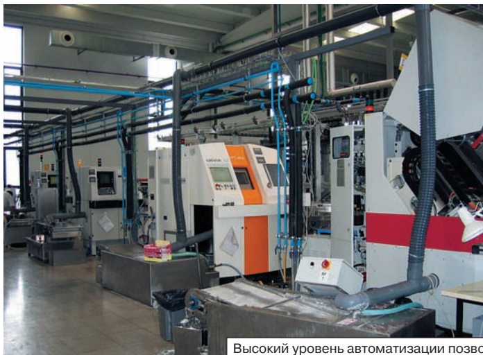
Высокий уровень автоматизации позволяет уменьшить количество работников

Для определения точных параметров компания выпускает автоматизирован-