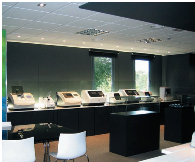
Демонстрационный зал технологического оборудования компании «Indo International»