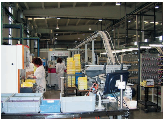
Обработка поверхности заготовок на генераторах